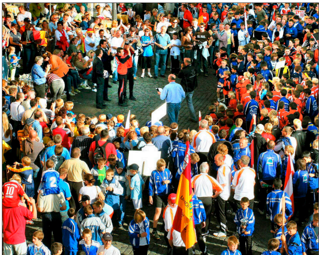
Ein internationales Jugendturnier führt hunderte Nachwuchsfußballer zur Siegerehrung auf den Weilburger Marktplatz. Drei Tage lang kicken Jungen und Mädchen aus Bosnien-Herzegowina, Belgien, Österreich, Polen und Ungarn mit Teams aus dem Oberlahnkreis um den Sieg.