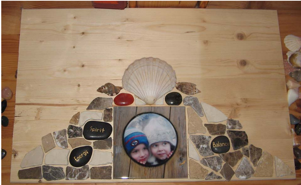
Abb. 2: Das Bild zeigt die beiden, als ich mit ihnen im Frankfurter Palmengarten den dortigen Spielplatz besuchte. Sie befinden sich in einem echten Holzschiff und schauen aus dem Bullauge. Ich suche mir aus meinem Pool selbst gesammelter Steine und Muscheln jene heraus, die in meinem gesitigen Entwurf am nächsten kommen und lege sie auf ein Holzbrett, so dass ich sie später im Bad zügig einbauen kann.