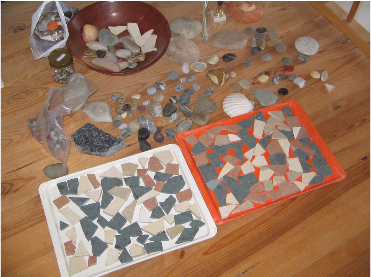
Abb. 1: Eine kleine Auswahl der gesammelten und teils selbst geschliffenen Steine sowie Abfallfliesen die ich zerschlagen habe um sie so als Mosaik miteinander kombinieren zu können.

Nachstehend ein paar Bilder die den Verlauf meiner Arbeit ein wenig dokumentieren und in zwangloser Folge hier ergänzt werden.