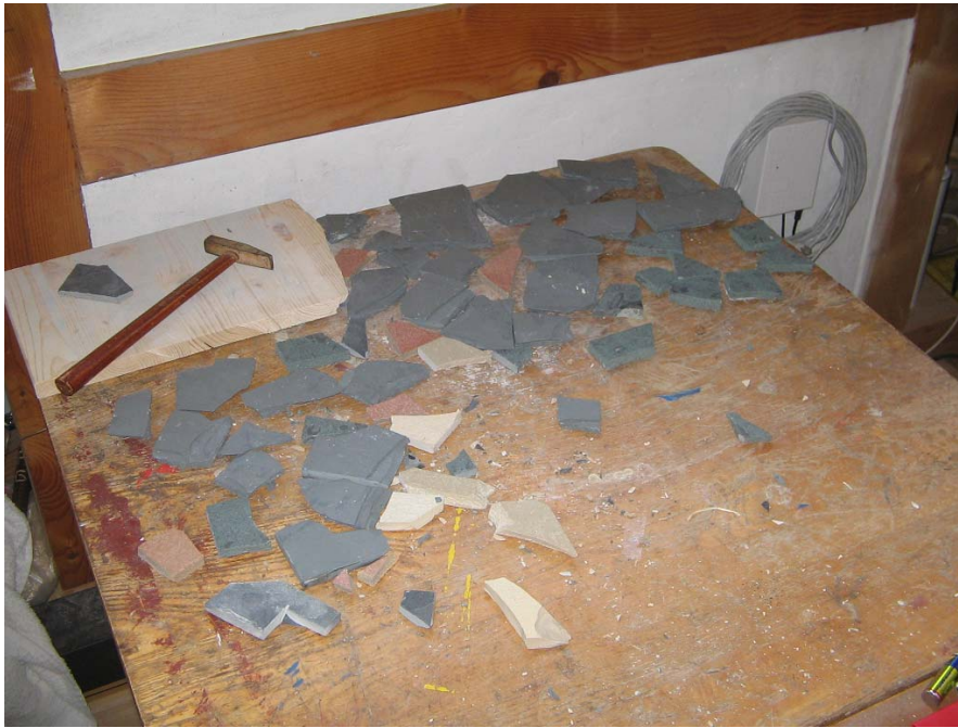
Abb. 1: Auch Naturschieferstücke, die andere weg geworfen haben, zerschlage ich zu Mosaikstücken.