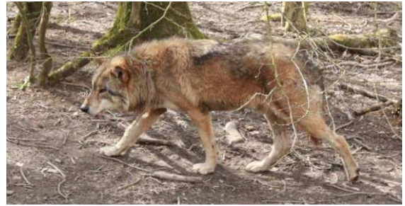
Abb. 5: Auch der Wolf war da