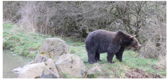
Abb. 4: Ja ein Braunbär