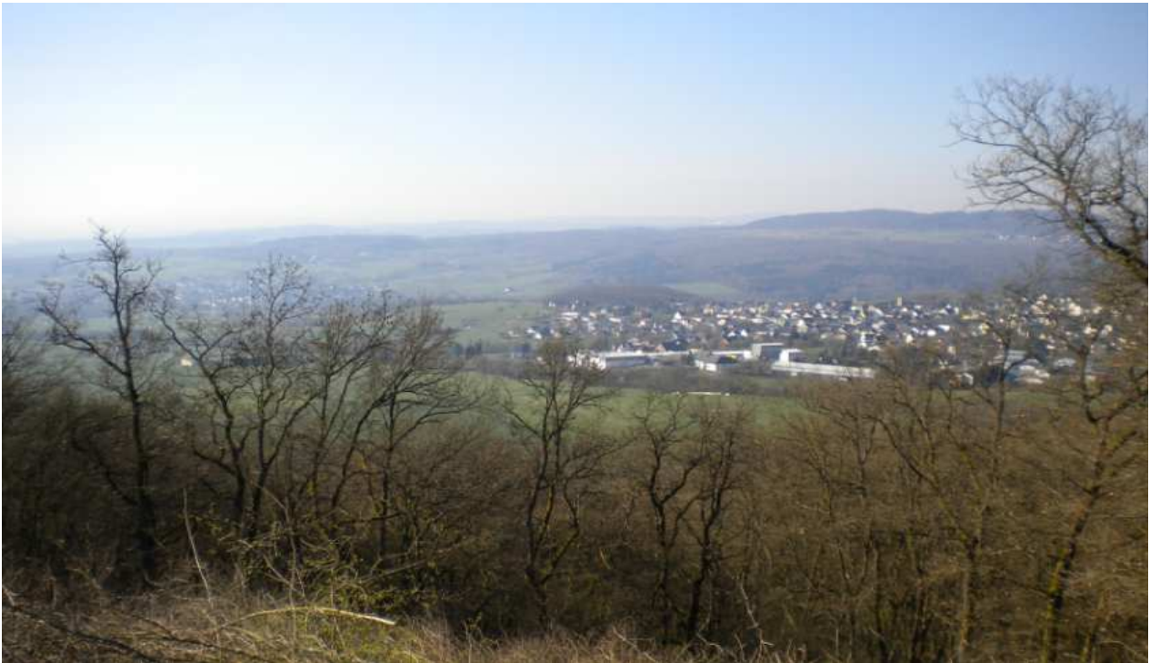
Abb. 2: Hier auf der Rückseite der Blasiuskapelle hat man einen schönen Blick ins Land Elfen und Heinzelmännchen von denen es im Westerwald noch einige Populationen gibt.

Auf der Heimfahrt traue ich meinen Augen nicht: