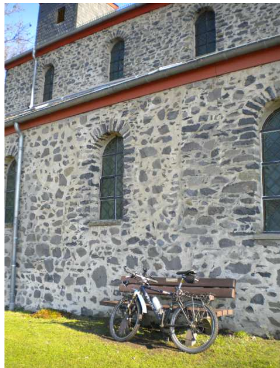
Abb. 1: Alte Freunde seit Kindertagen: Mein altes TREK-MTB und die alte Blasiuskapelle.