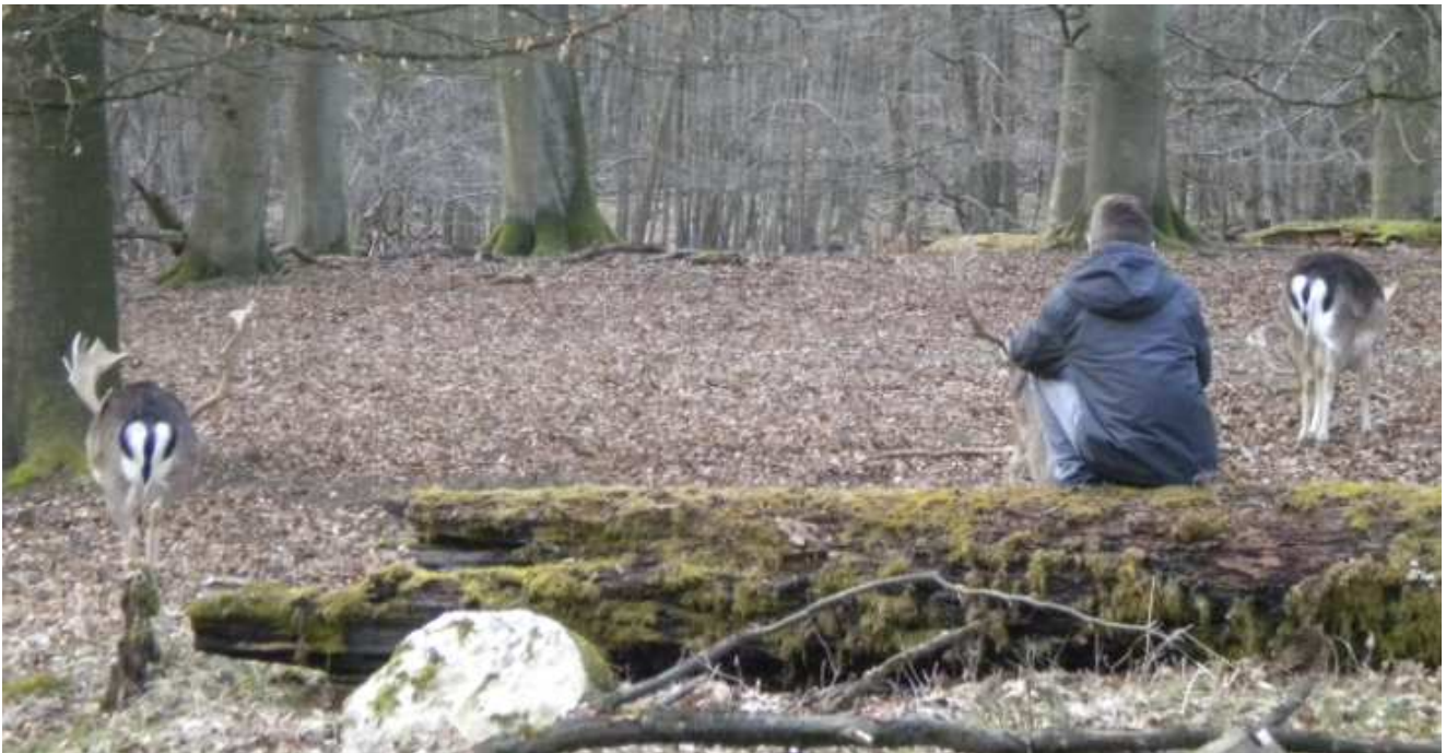
Abb. 7: Die Bilder sind für'n Arsch (sorry)